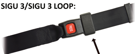
Abb. 2: Die mit Pfeilen gekennzeichneten Kunststoffkappen sind fest mit der Zunge verbunden und dürfen nicht gewaltsam entfernt werden!