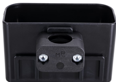
Montage an einem senkrechten Rohr