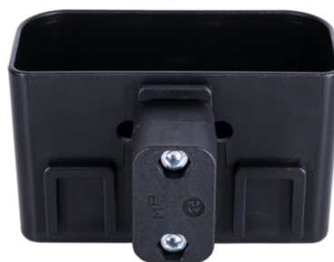
Montage an einem waagerechten Rohr