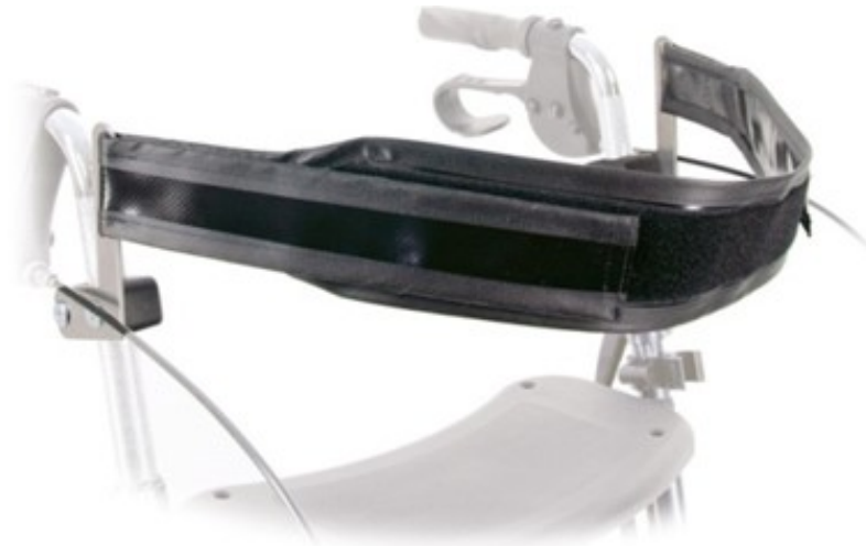
Abb. 2: Anbau des Rückengurts am Rollator (die Rückengurtplatte zeigt nach außen)

Nach Montage der Halterungen ziehen Sie bitte den Rückengurt (1) durch die Schlitze der Rückengurtplatten ( Abb. 2 ). Achten Sie dabei darauf, dass der Klettbereich nach außen zeigt. Nun können Sie den Gurtbereich mit Hilfe des Klettverschlusses individuell auf Ihre Bedürfnisse stufenlos anpassen. Bitte beachten Sie, dass der Rückengurt, so wie in der Abb.2 gezeigt, relativ waagrecht angebracht wird. Wenn der Rückengurt zu weit herunterhängt, besteht die Gefahr, dass Sie beim Anlehnen keine ausreichende Auflagefläche haben und schlimmstenfalls nach hinten stürzen.